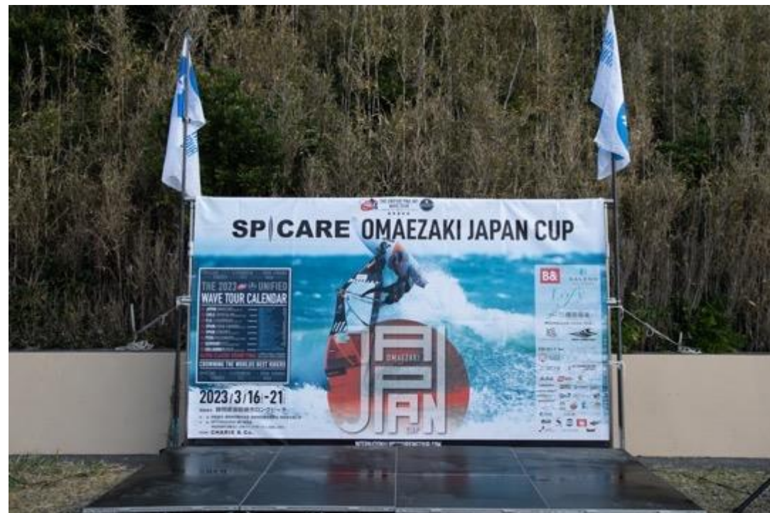
大会メインバナー